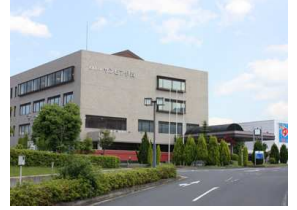
い が サンビア伊賀