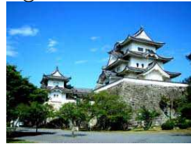
い が うえ の じ ょ う 伊賀上野城